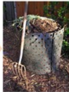
Seen by the York Project from 2011 to 2013, March 28, 2011